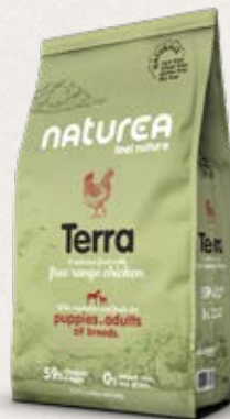
Taille des croquettes