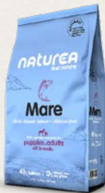
Taille des croquettes